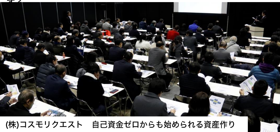
(株)コスモリクエスト 自己資金ゼロから始められる資産作り