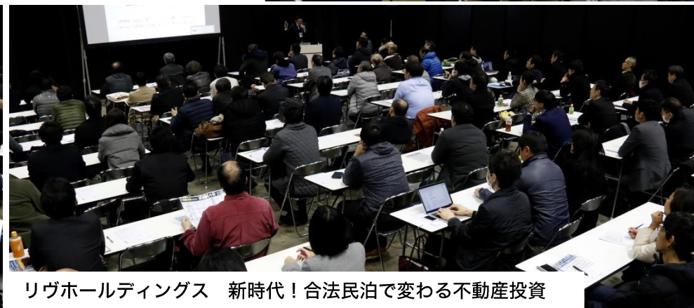
リヴホールディングス 新時代！合法民泊で変わる不動産投資